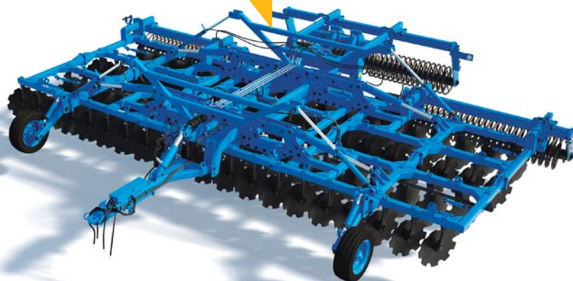
Дисковая борона БДП 8х4 МТ